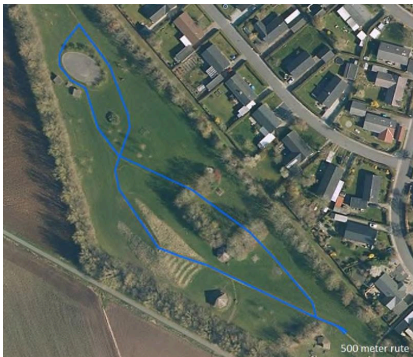
Billede 1: Placering af motionssti på Den Grønne Kile.

Motionsstien vil have en rundstrækning på 500 meter, hvor der vil være fire forskellige "stationer" med naturredskaber. De fire naturredskaber har fokus på træning af hele kroppen. Initiativgruppen ønsker, at de nye stationer holdes i samme byggestil som naturlegepladsen. Redskaberne er udført i robiniekernetræ med en holdbarhed på 25-40 år.